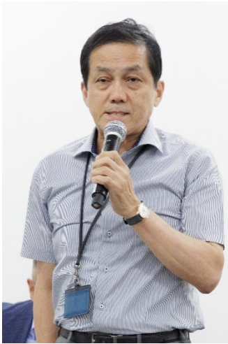
国際労働機関駐日事務所 高崎真一駐日代表