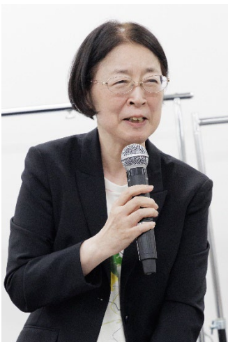
全国社会福祉協議会 村木厚子会長