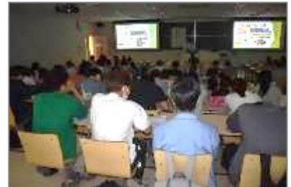
自治医科大学医学部