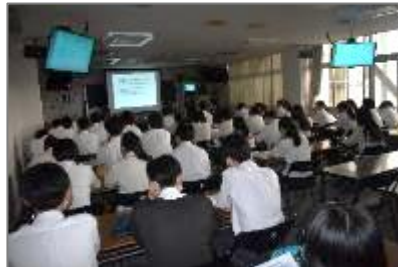
作新学院高等学校