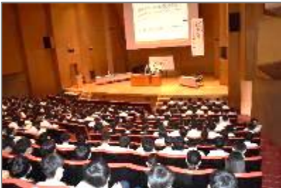
宇都宮短期大学附属高校